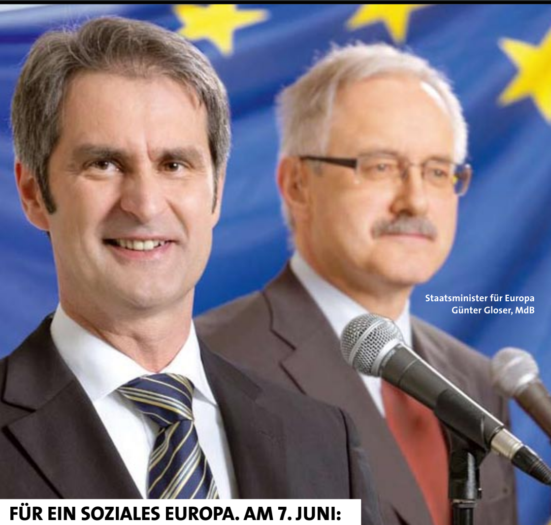
Staatsminister für Europa Günter Gloser, MdB